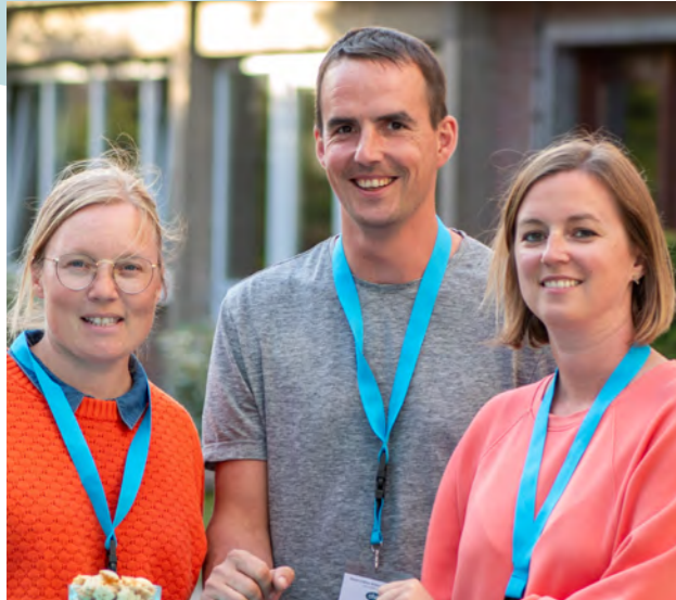
met een enthousiast en deskundig lerarenkorps

Wij bieden een krachtige leeromgeving aan waarin elk talent zich kan ontplooiën