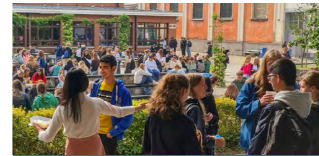
OLVP on campus