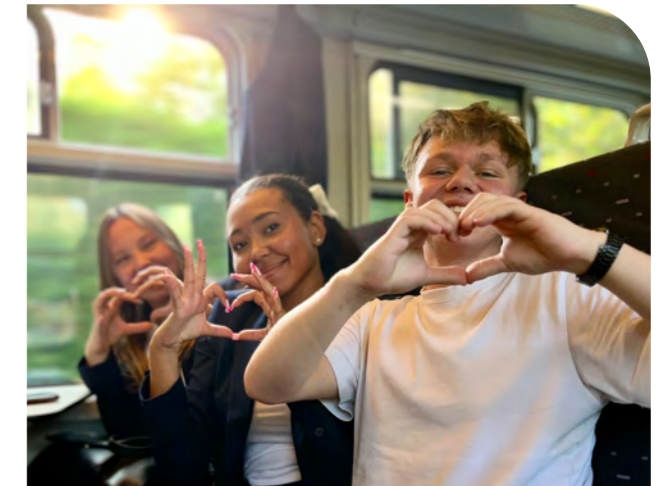
OLVP on the road