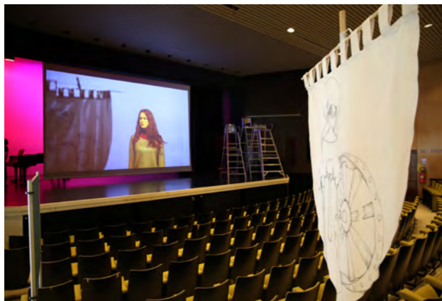
met een goed uitgebouwde infrastructuur