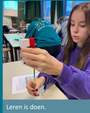
Leren is doen.

Ook leren kan je leren . Dat vraagt tijd en inzet, geduld en discipline. Onze vakleraren en leerbegeleiders zetten je op weg en sturen bij waar nodig.