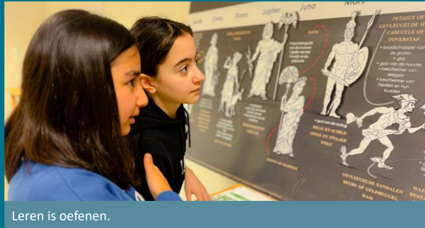
Leren is oefenen.

We wakkeren je nieuwsgierigheid aan en stimuleren een kritische blik.