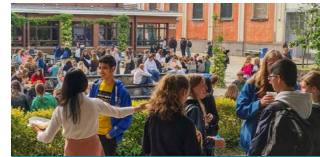
OLVP on campus