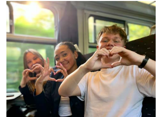
OLVP on the road